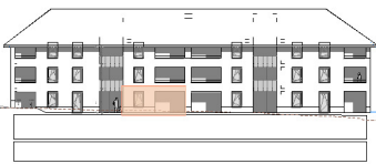
élévation Ouest 1:1000